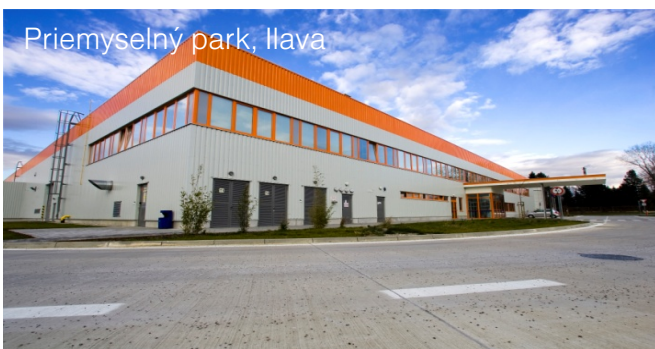
Priemyselný park, Ilava

V majetku fondu od 06/2008, plocha k prenájmu: 4 900 m 2 Významní užívatelia: Asseco Slovakia