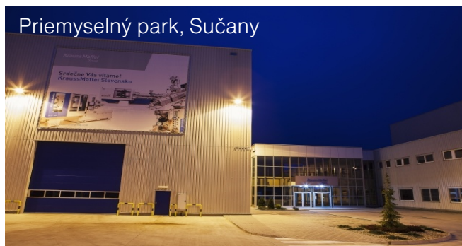
Priemyselný park, Sučany

V majetku fondu od 03/2014, plocha k prenájmu: 26 000 m 2 Významní užívatelia: HB Reavis, Johnson & Johnson, AON