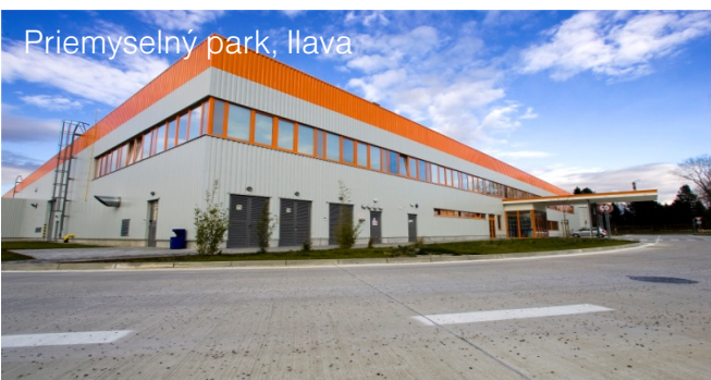
Priemyselný park, Ilava

V majetku fondu od 06/2008, plocha k prenájmu: 4 900 m 2 Významní užívatelia: Asseco Slovakia