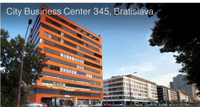
City Business Center 345, Bratislava

V majetku fondu od 06/2008, plocha k prenájmu: 4 500 m 2 Významní užívatelia: Tesco